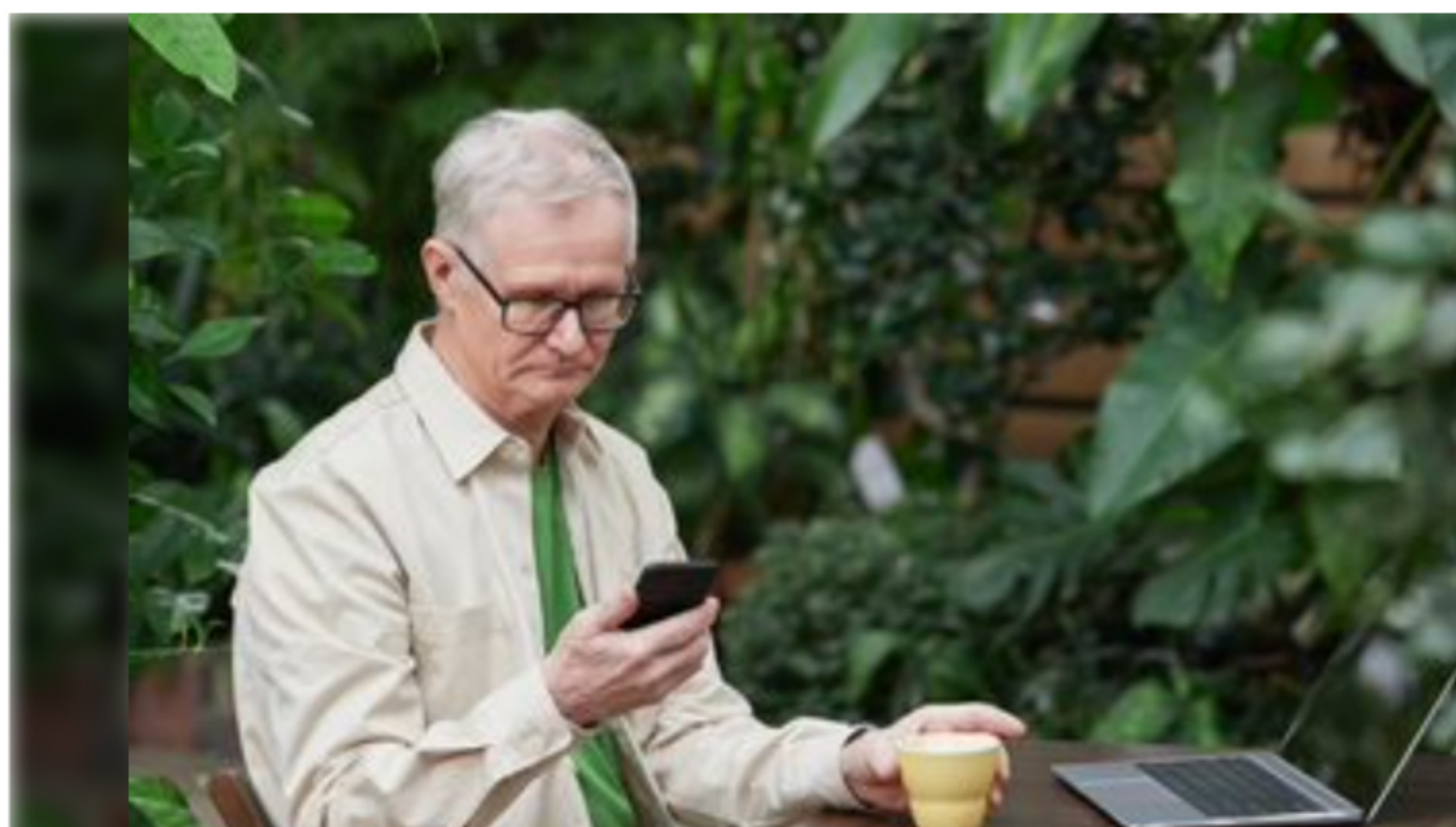
Des sites spécialisés de plus en plus nombreux